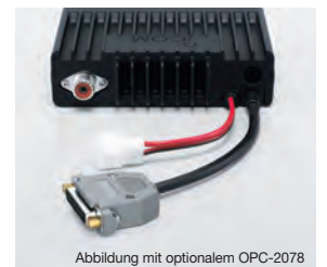
Abbildung mit optionalem OPC-2078

Zur Steuerung des NF-Ausgangs, des Modulationseingangs, zur Fernbedienung, zum Steuern eines Signalhorns und für viele weitere Funktionen stehen optionale Zubehörcable zur Verfügung. Das OPC-1939 ist die Sub-D-15-Pin-Ausführung und das OPC-2078 die 25-polige Variante des Kabels.